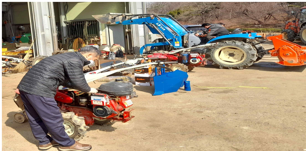
계양구 오류동 농기계순회수리교육(21.3.)