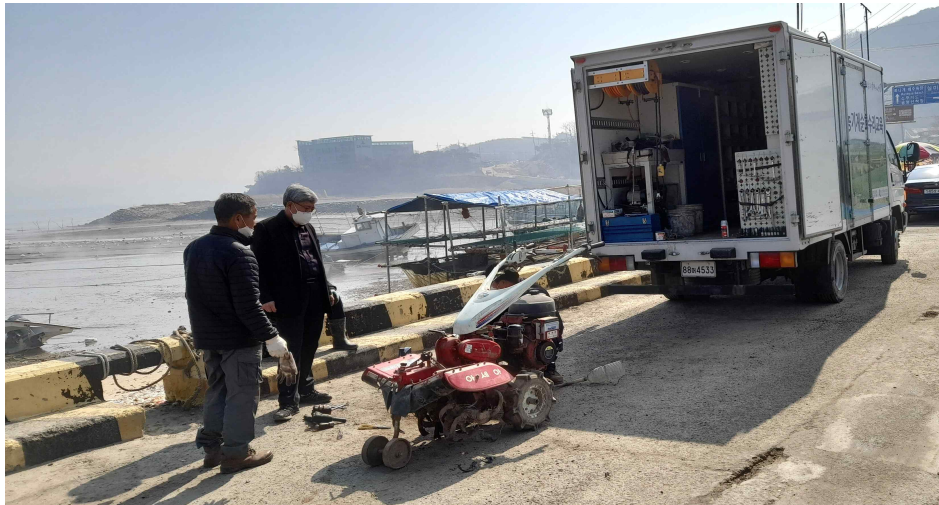
중구 무의동 농기계순회수리교육(21.3.)