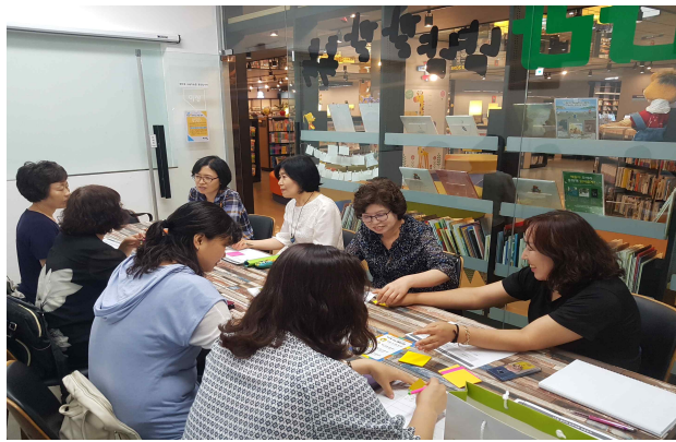
학습동아리 활동(환경학습동아리 지정 예정)