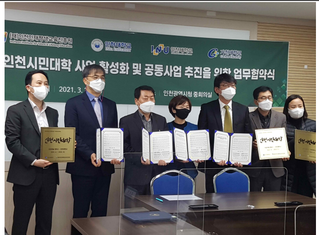
2021.3.23. 인천시민대학 환경캠퍼스 지정