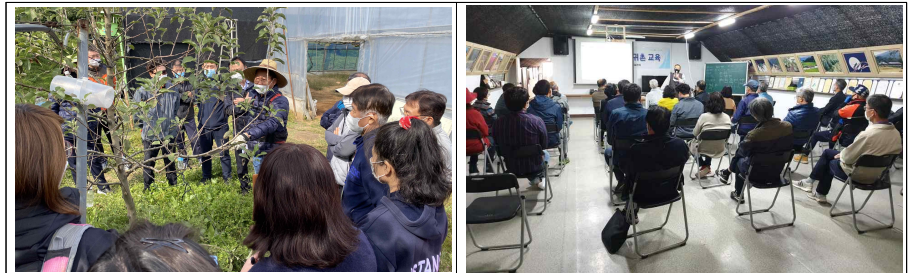
제11기(2020년도) 귀농·귀촌 교육사진