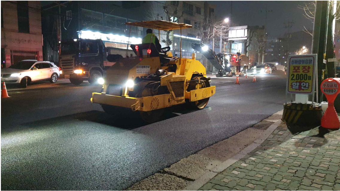
도로 포장 사진(21.3.)