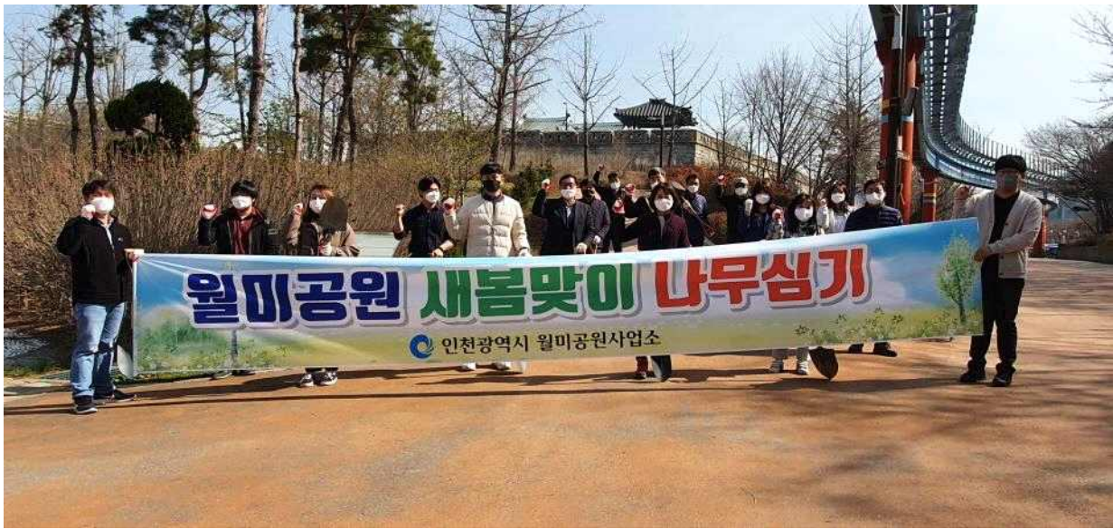
나무심기 행사 사진(21.3.)