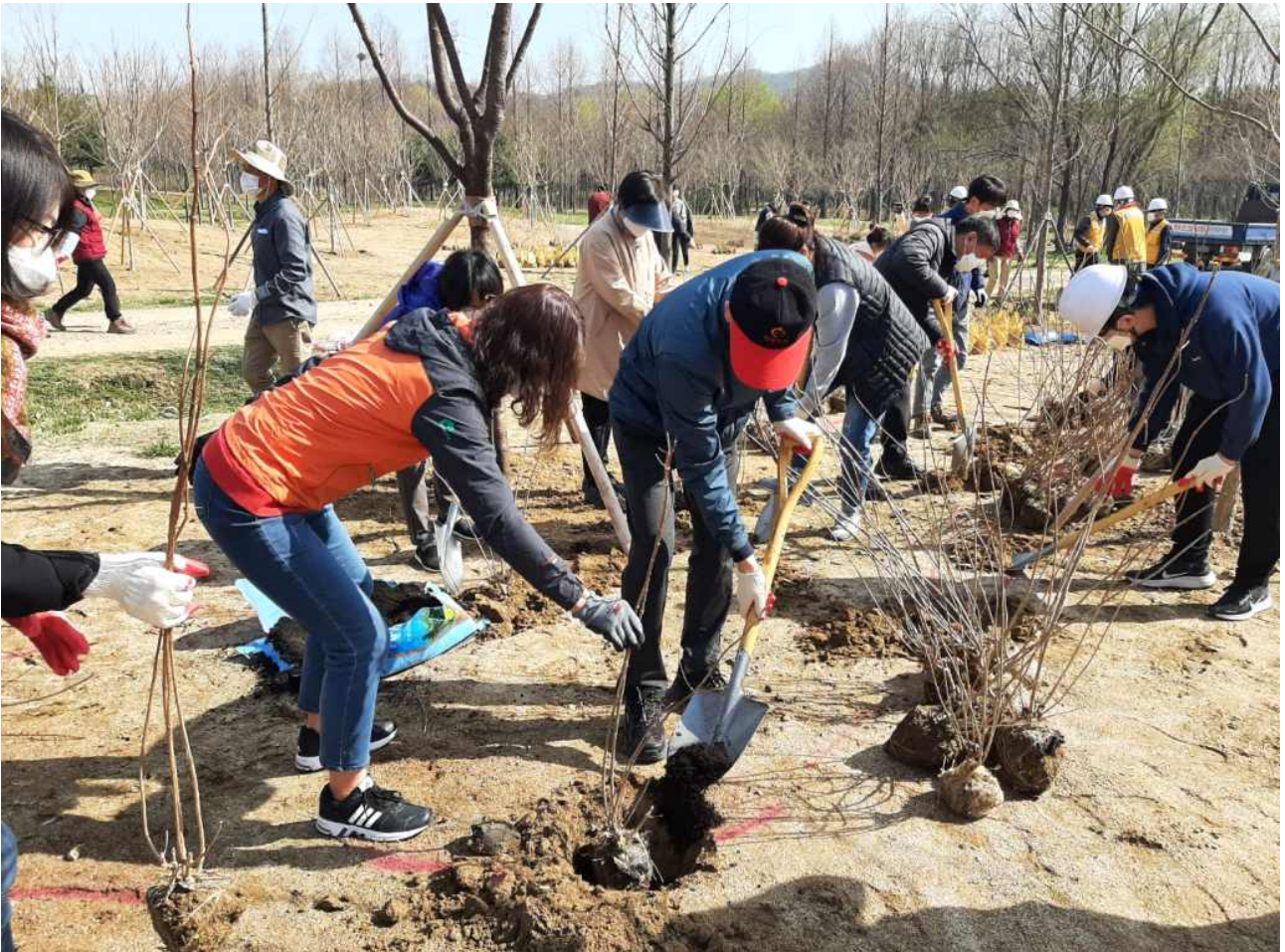
<붙임> 제76회 식목일 기념 나무심기 행사 사진(21.3)

대공원을 더욱 아름답게 만들어 코로나로 지친 시민을 위로할 수 있는 공원이 되도록 매진하겠다.” 고 말했다.