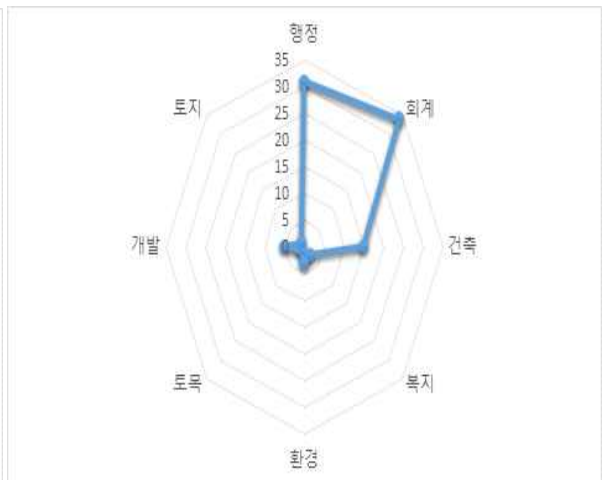
신청 분야별 신청 비율