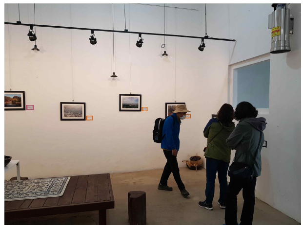
월미공원 탄약고갤러리 사진