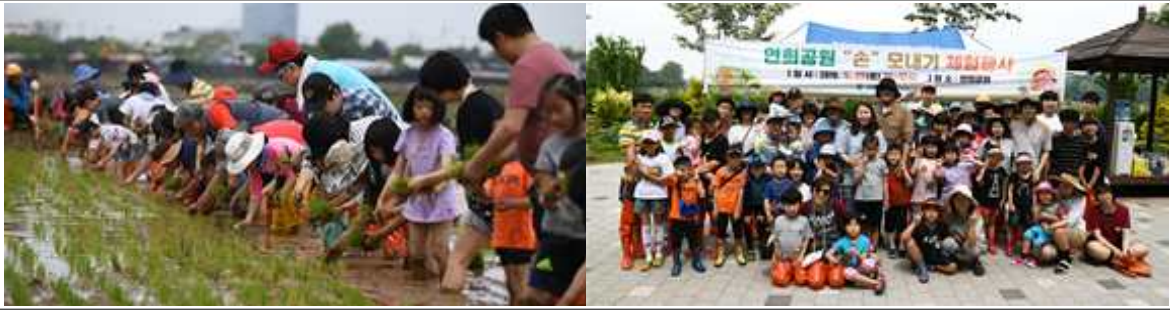
연희공원 '손'모내기 체험 사진자료