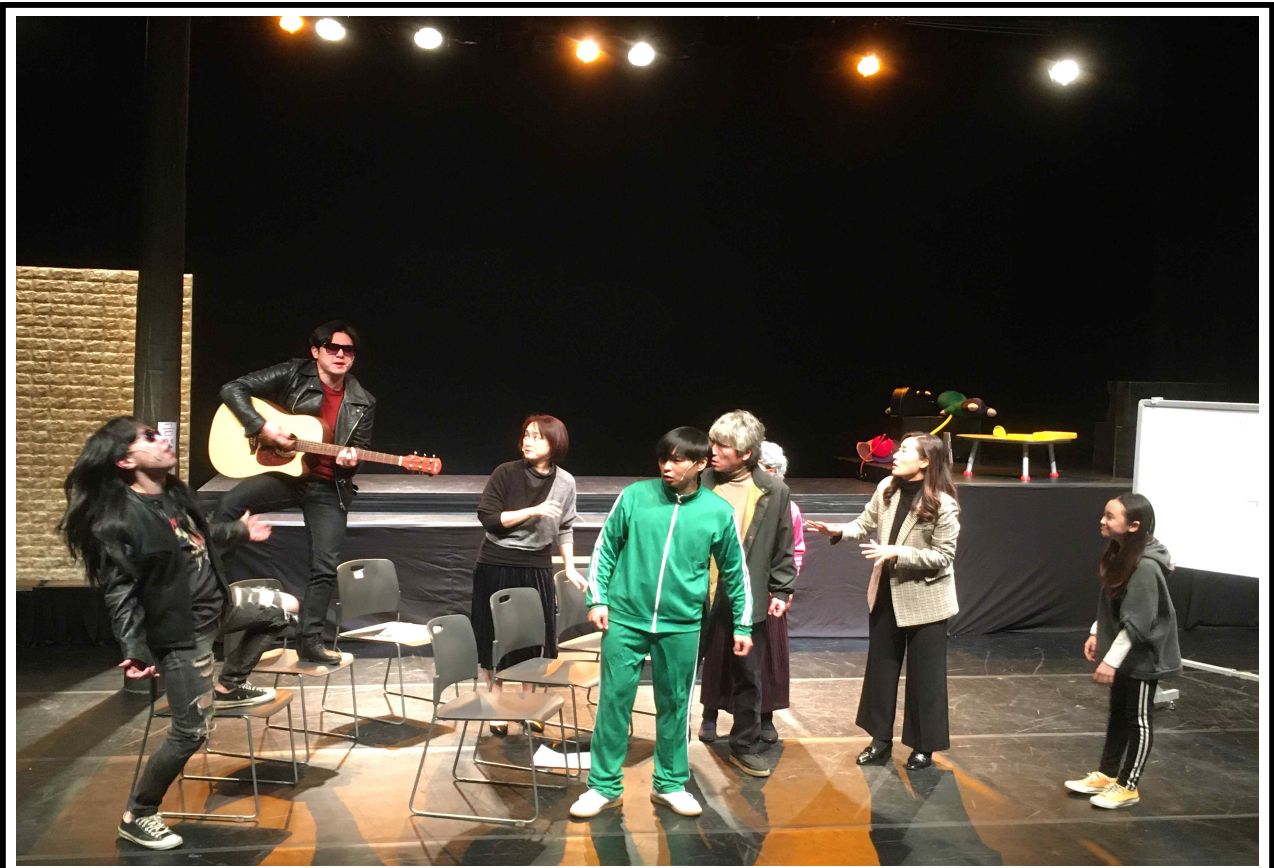
“함께 하는 세상” 연극공연(사진)