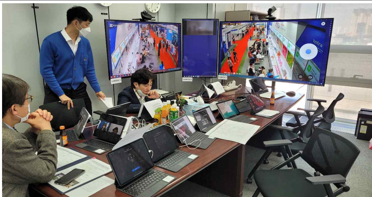
인천테크노파크 사무실(기업과 바이어 매칭)