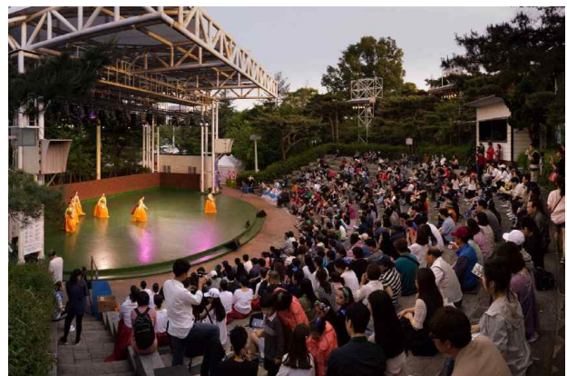
야외 예술무대 <황.금.토.끼> 공연사진