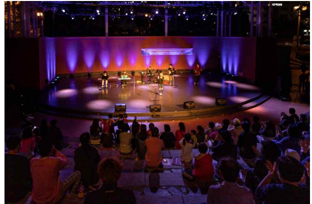
야외 예술무대 <황.금.토.끼> 공연사진