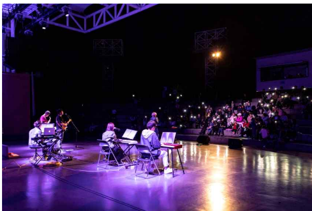
야외 예술무대 <황.금.토.끼> 공연사진