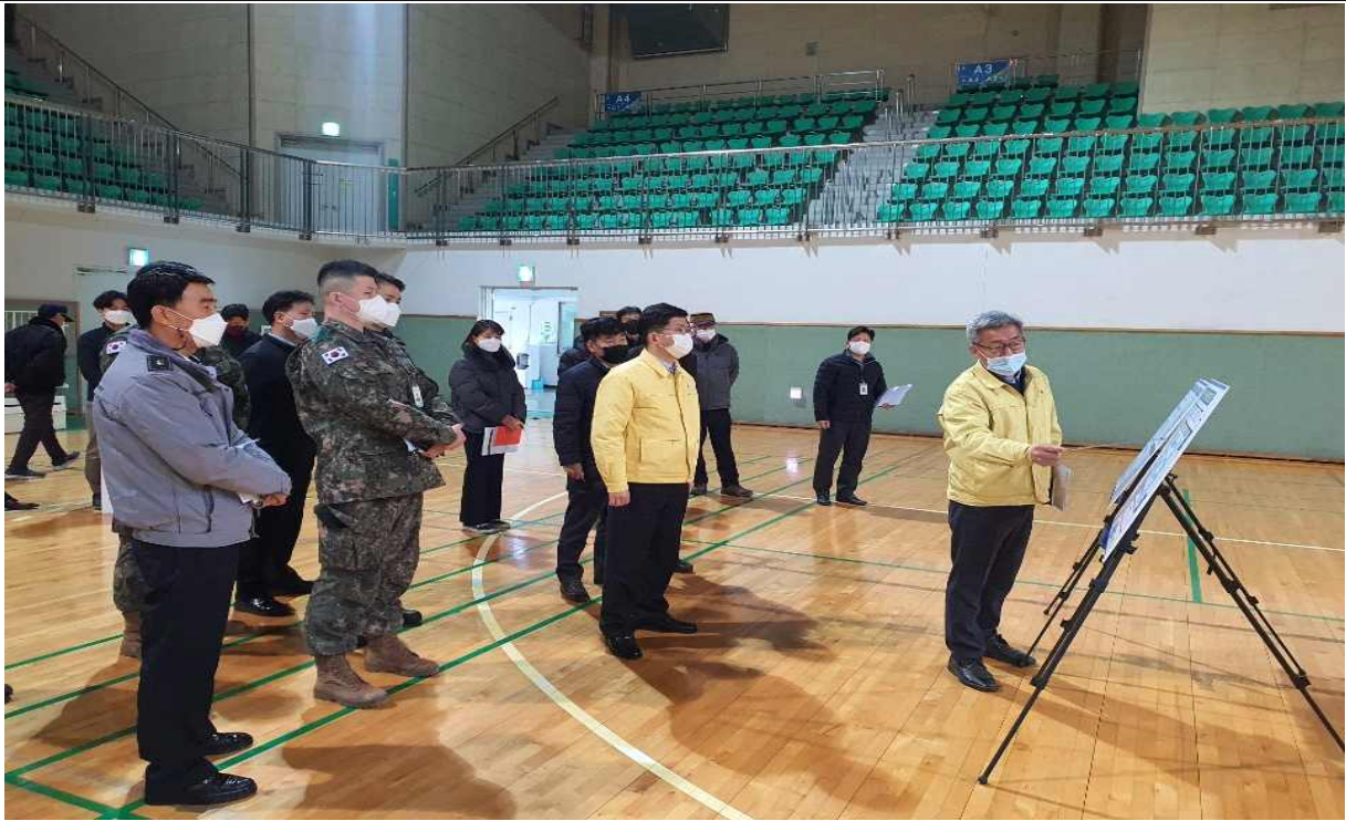
연수구 선학체육관 방문 사진(3.23.)