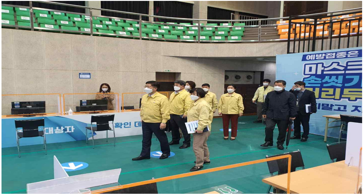
강화군 강화문예회관 방문 사진(4.12.)