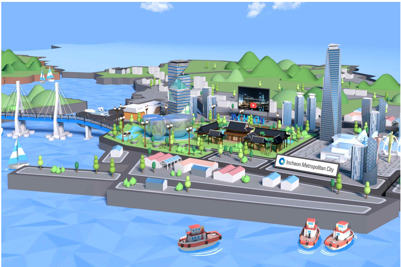
<3D 온라인 회의 플랫폼>