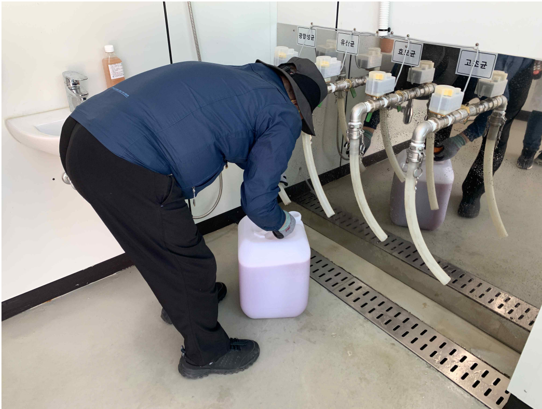
<붙임> 유용미생물 배양 관련 사진