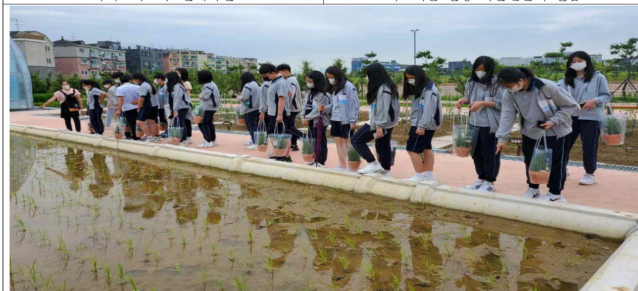
도시농업체험포 시설 견학