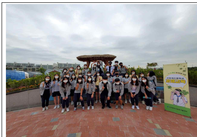
과제교육 2부 단체사진