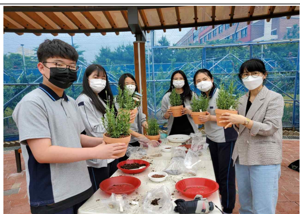
허브식물 활용 화분만들기 실습