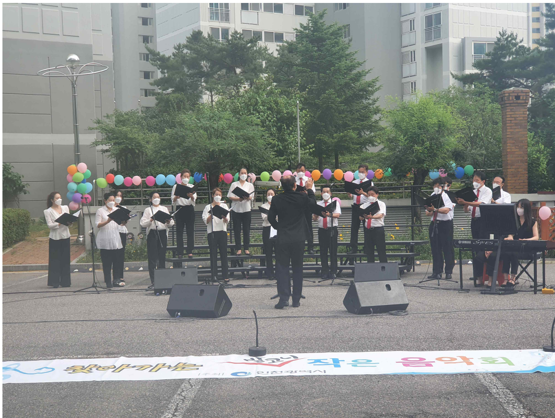
<발코니 작은 음악회 사진(21.6.11.)>