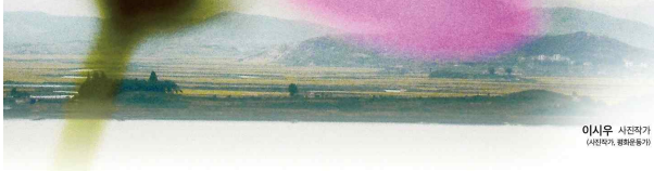
이시우 사진작가 (사진작가, 문화운동가)

유튜브 검색창 obs 다류 검색 ⇒ 해당 채널로 바로 들어오실 수 있습니다.