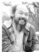
이시우 사진작가 (사진작가, 평화운동가)