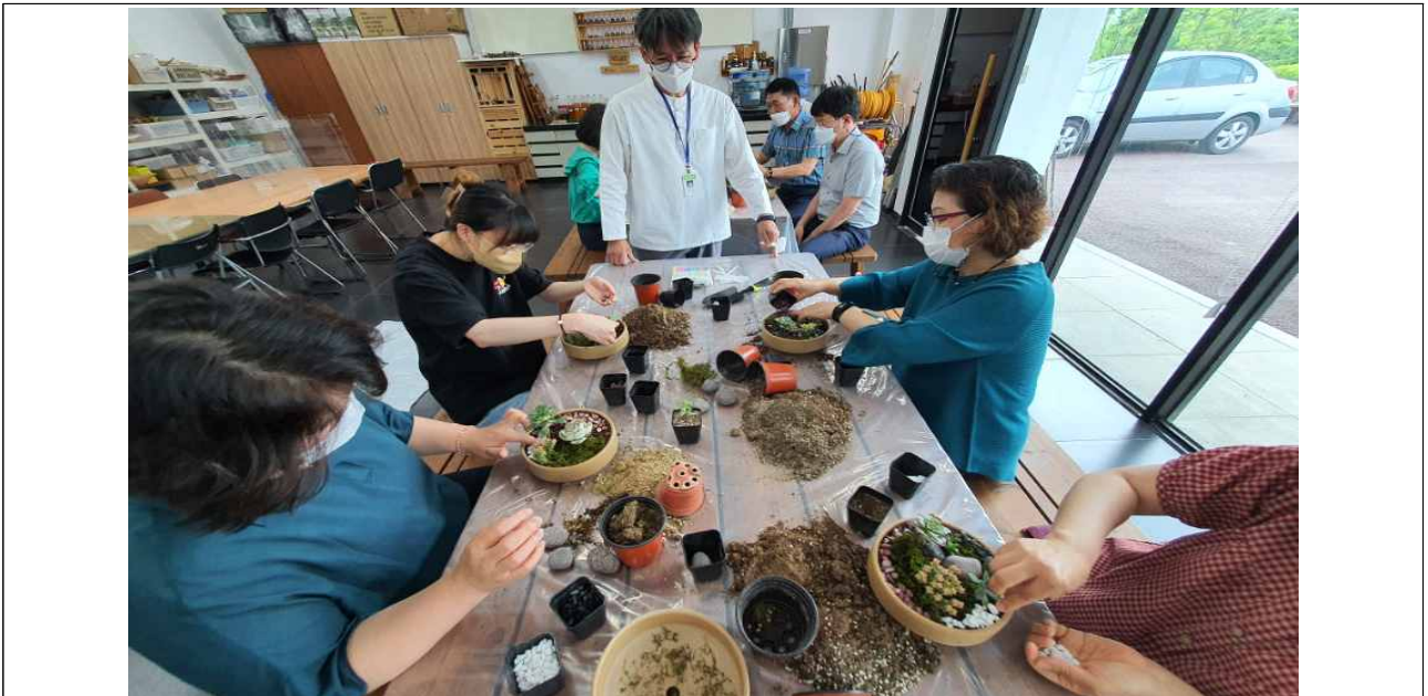
반려식물 만들기 프로그램 진행 사진 1