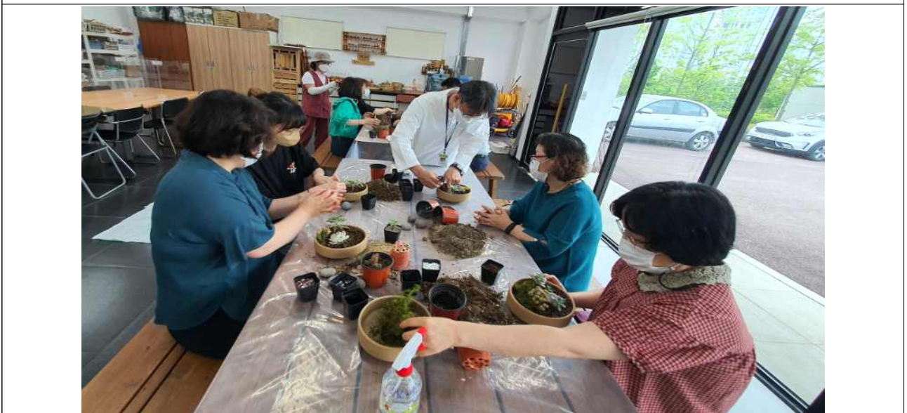
반려식물 만들기 프로그램 진행 사진 2