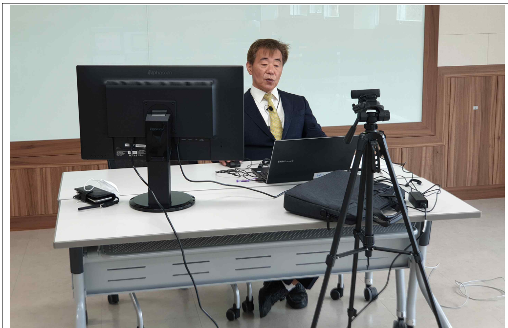
사진 : 2021년 강소농 경영개선 기본교육