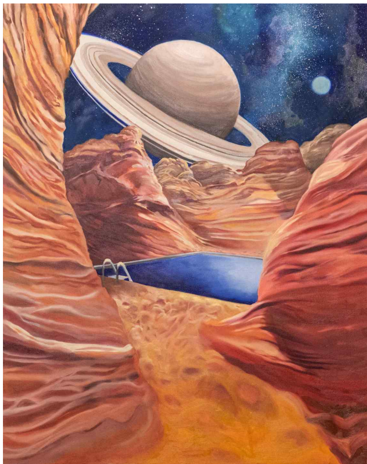
< 양윤정(인천예술고등학교)의 작품 >