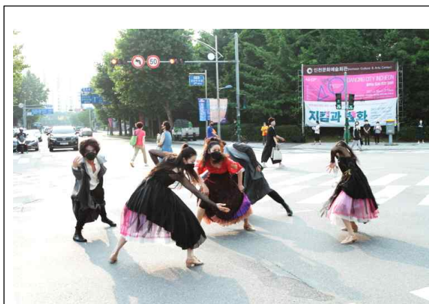
횡단보도 플래시몹 “해피백신”