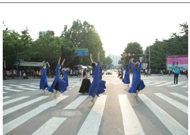
횡단보도 플래시몹 “해피백신”