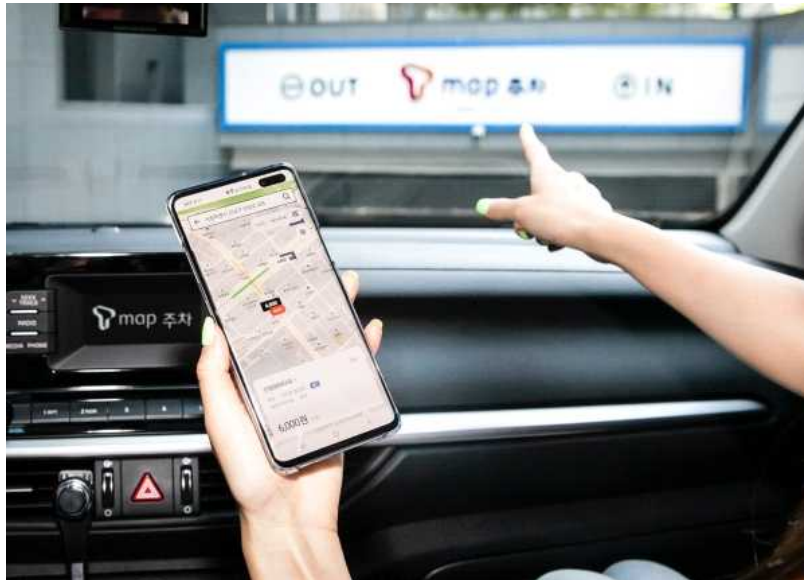
[T map 주차 이미지 1]