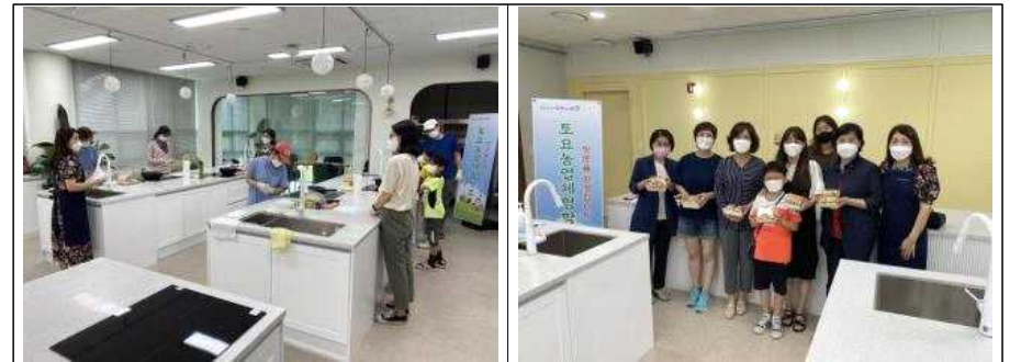
6월 26일에 진행한 우리쌀 소비촉진을 위한 디저트 만들기 체험