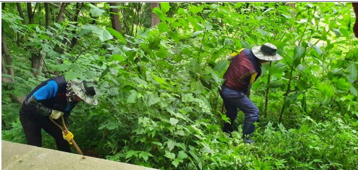
월미공원 둘레길 주변 미국자리공 제거작업 현황사진