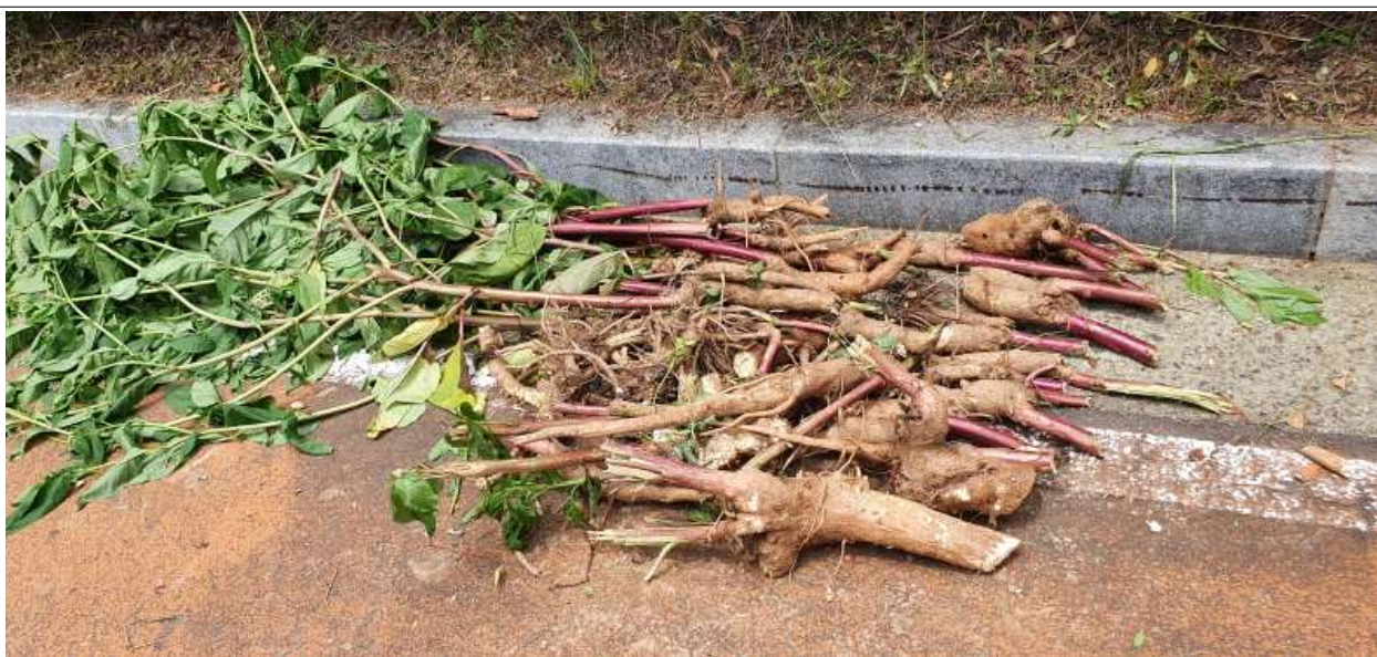
미국자리공 제거 후 현황사진