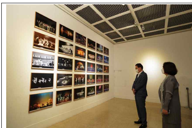
전시장을 방문한 박남춘 시장