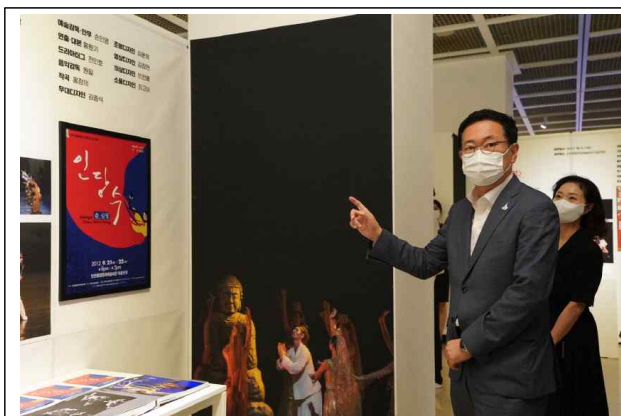
전시장을 방문한 박남춘 시장