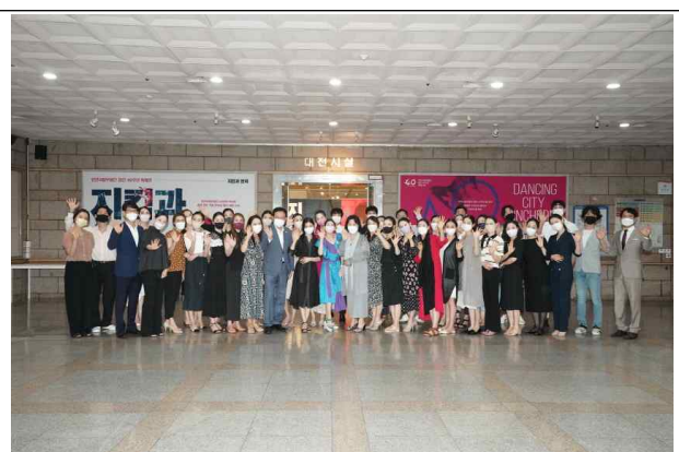
인천시립무용단과 박남춘 시장 단체사진