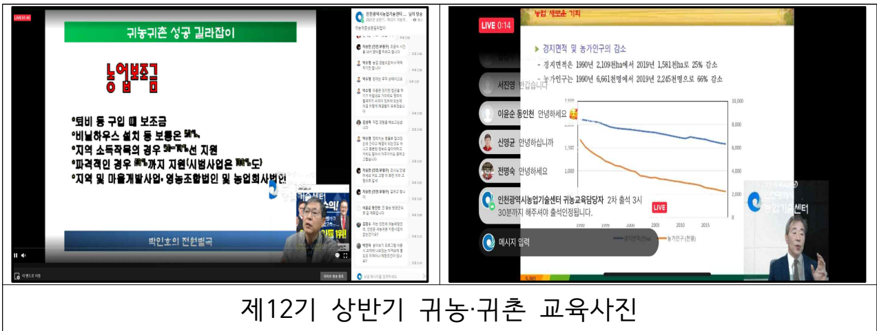
제12기 상반기 귀농·귀촌 교육사진