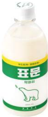
「붙임 6」 곰표 굿즈 - 표문맥갈리