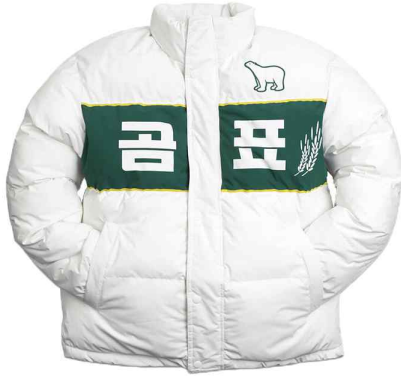
「붙임 5」 곰표 굿즈 - 밀가루 패딩