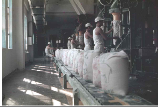
「붙임 4」 대한제분 공장 내부 모습