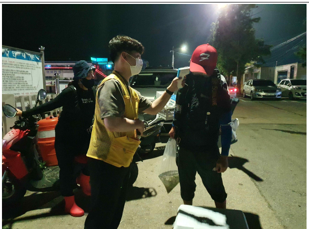
< 낚시어선 점검사진 >