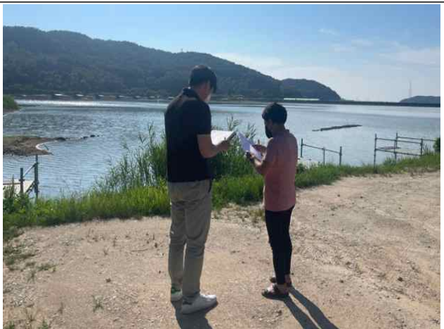
< 낚시터 점검사진 >