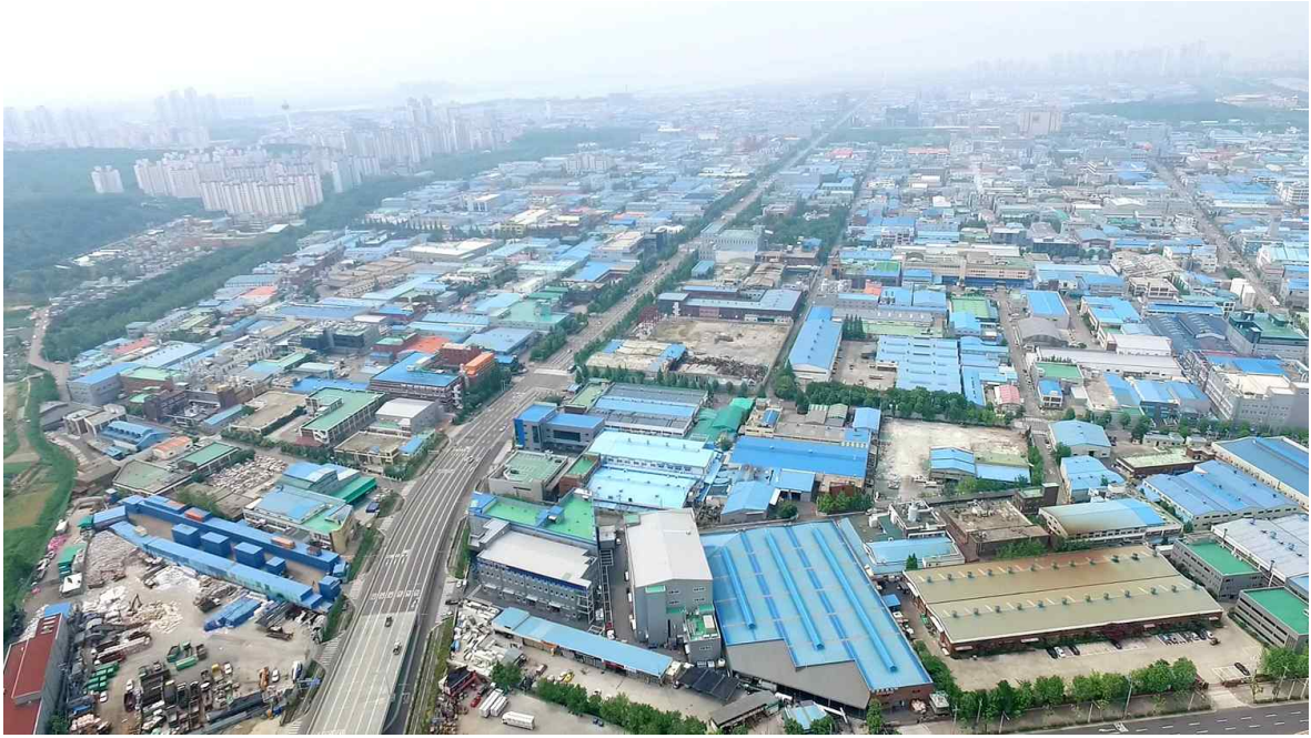
〈 남동공단 〉