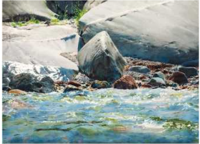
Stanislaw Zoladz 'Windy day' (스웨덴)