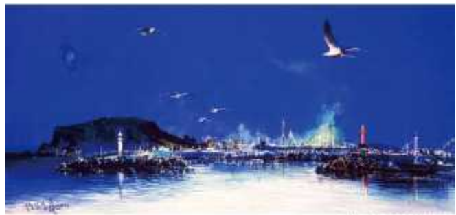
김성용 '무도인상' (한국)