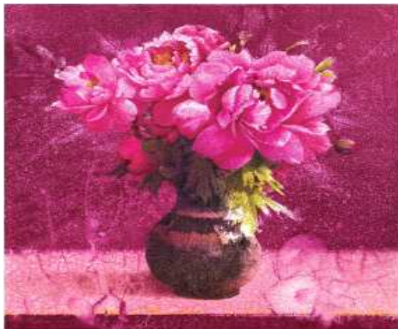
김종원 '오란' (한국)