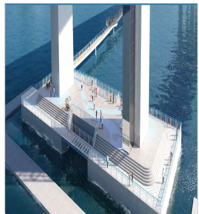
주탑 하부 쉼터, 보도교