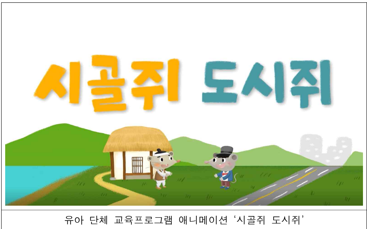
유아 단체 교육프로그램 애니메이션 ‘시골쥐 도시쥐’