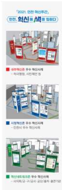
*** 2021 우수 혁신사례 배치도 (ZONE별)