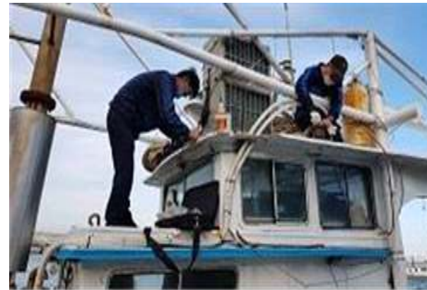
<붙임> 선박 수리 사진