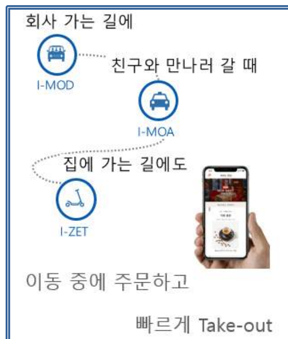
《 I-Order 서비스 이미지 》