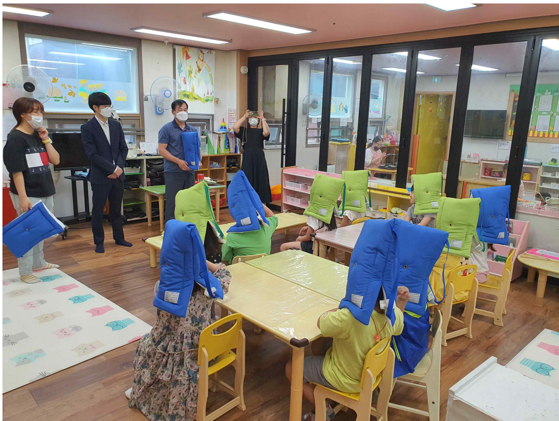
< 지진방재 교육 및 지진방재모자 전달 >