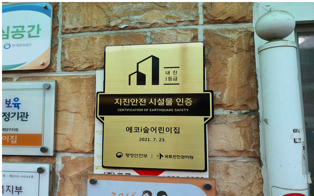
< 지진안전 시설물 인증 명판 >