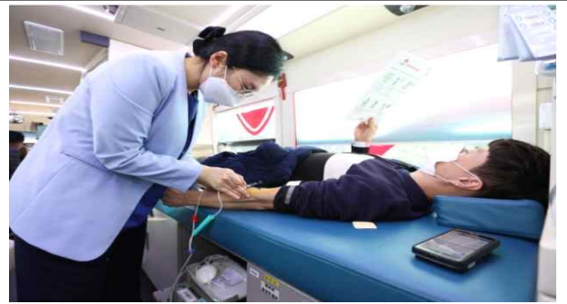
헌혈버스 단체 헌혈 모습