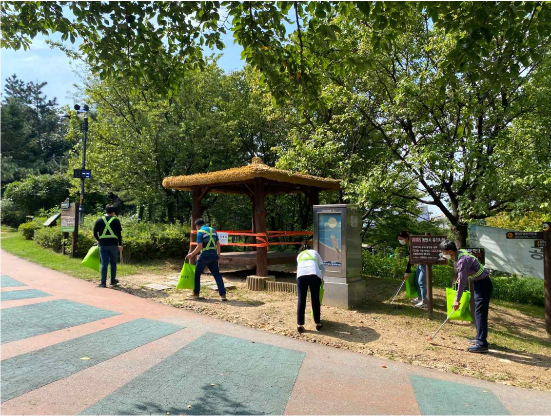
추석맞이 환경정비에 나선 월미공원사업소 직원들과 대한민국특수임무유공자회