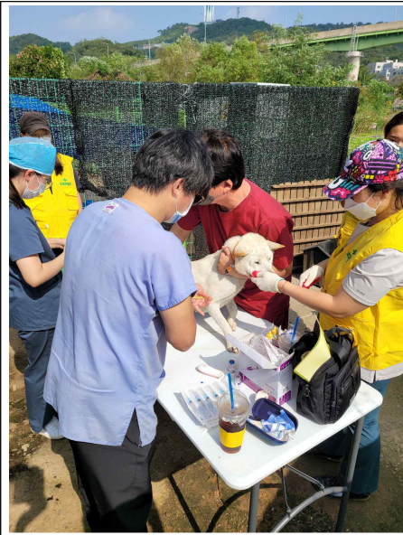
<붙임> 유기견 진료 사진(' 21.10.3.)