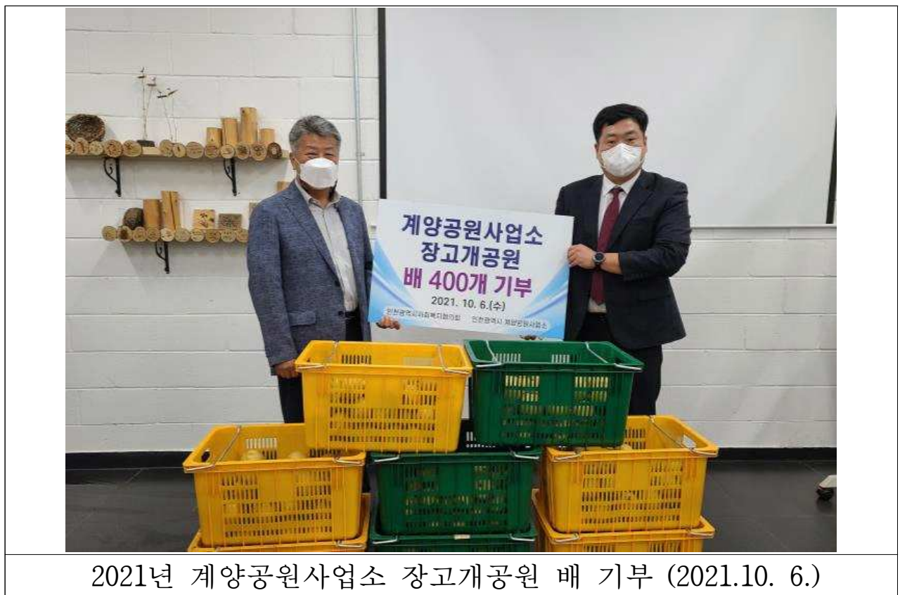
2021년 계양공원사업소 장고개공원 배 기부 (2021.10. 6.)