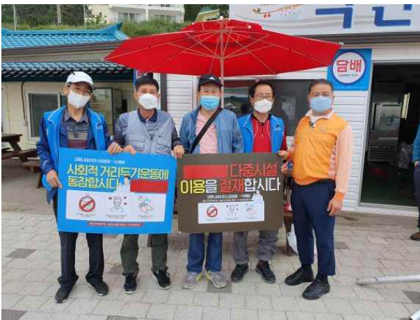
에너지절약 홍보 캠페인