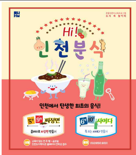
주말 어린이 교육프로그램 ‘Hi, 인천분식’