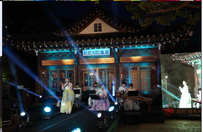
비대면 한복패션쇼 녹화현장