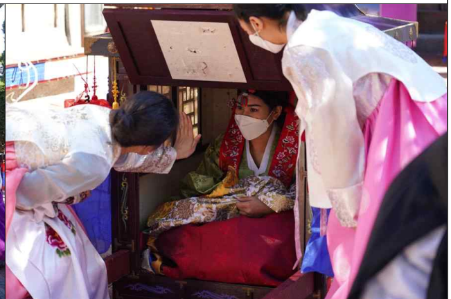
비대면 전통혼례 녹화현장