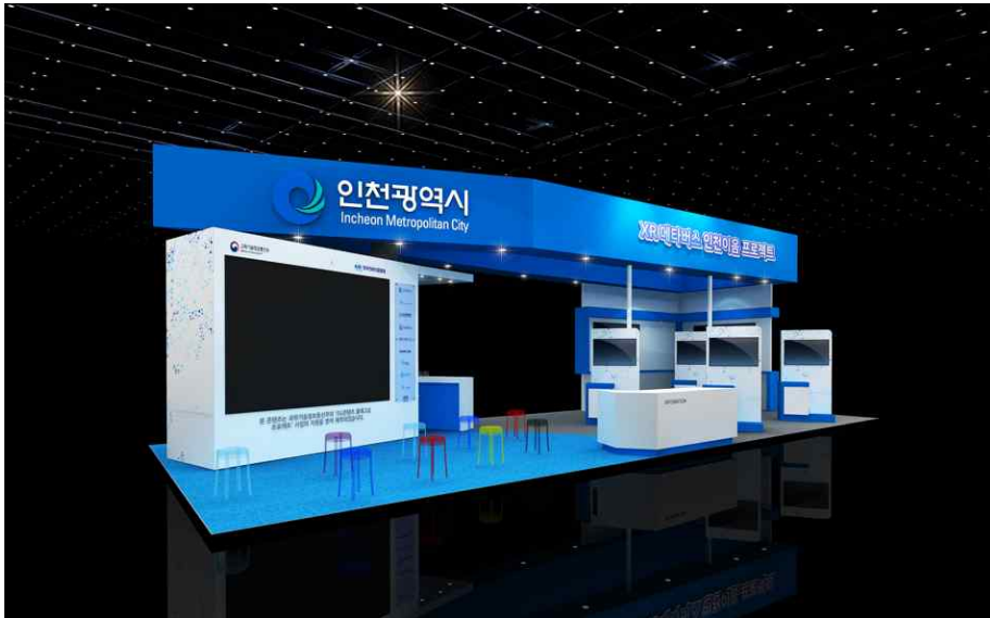
<메타버스 코리아 전시관 내 설치될 인천시 홍보전시관 조감도>