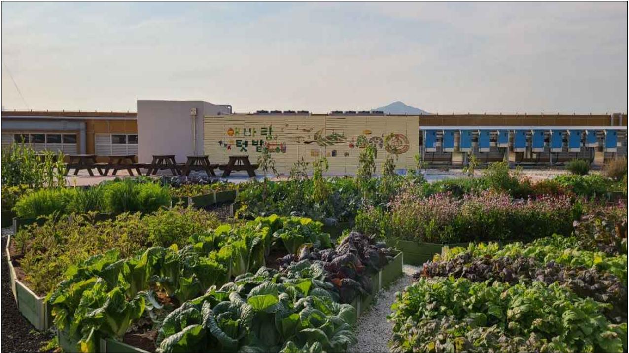
남촌농산물도매시장 옥상텃밭 전경