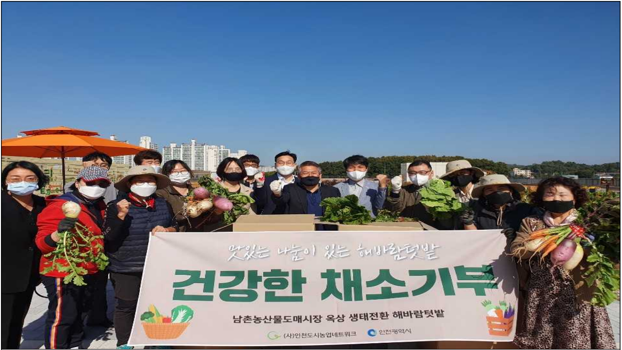
옥상텃밭 생산한 농산물 기부 사진