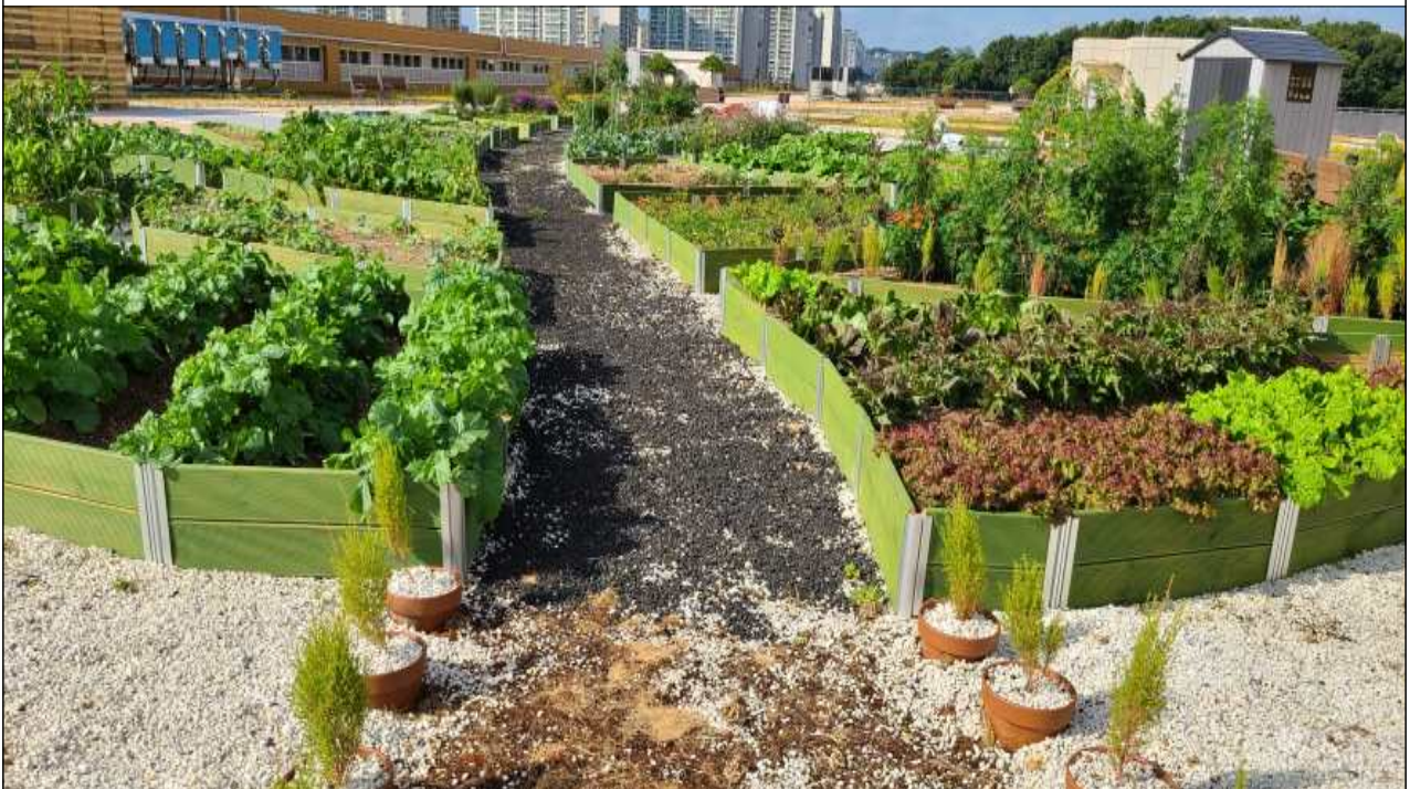
옥상텃밭 내 나뭇잎 형태의 텃밭 모습