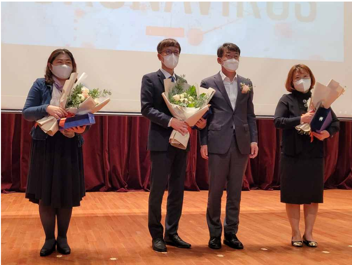
<인천시 기획재정부장관 표창 수상>