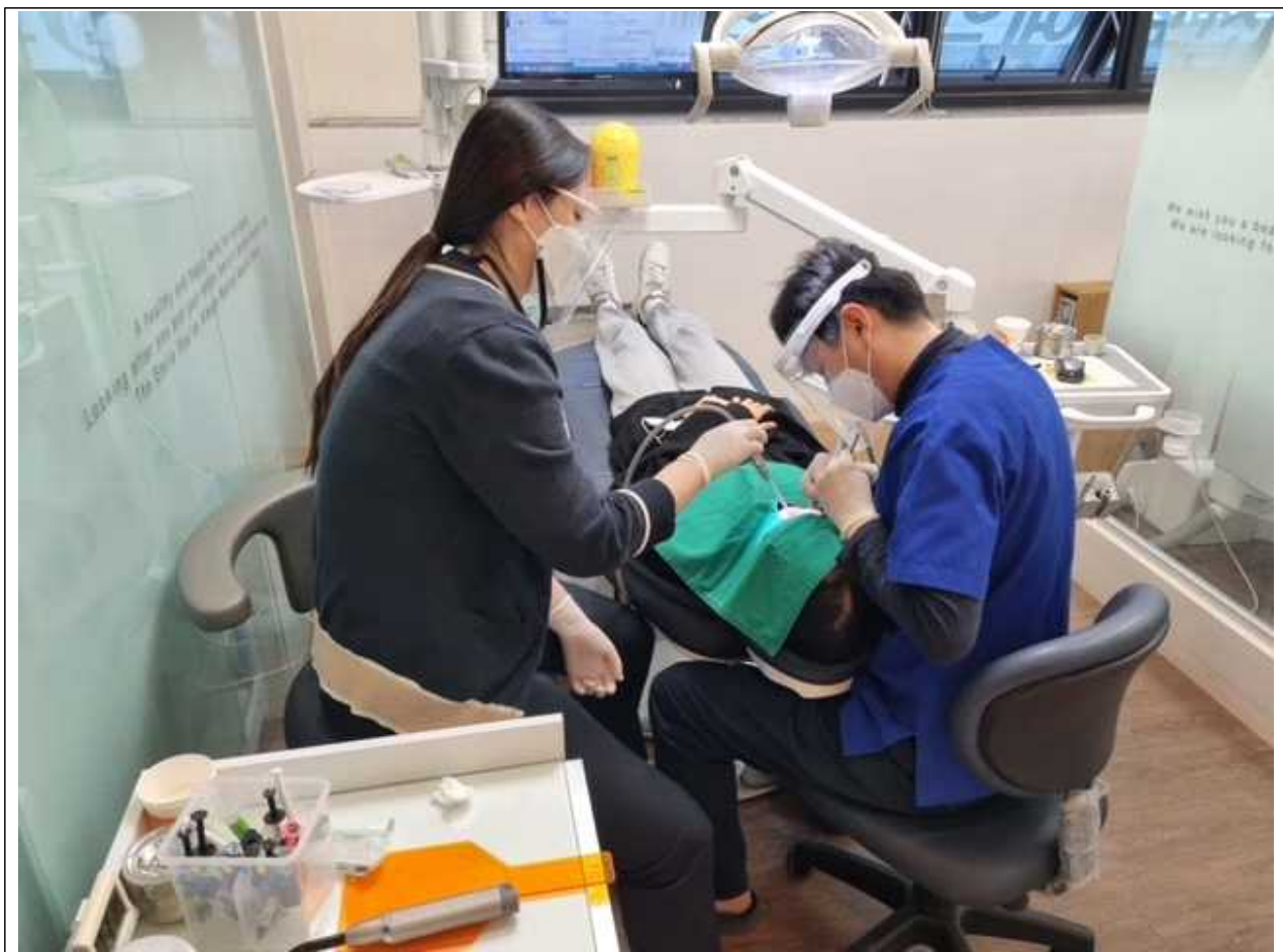
[붙임3] 아동 치과주치의 관련사진