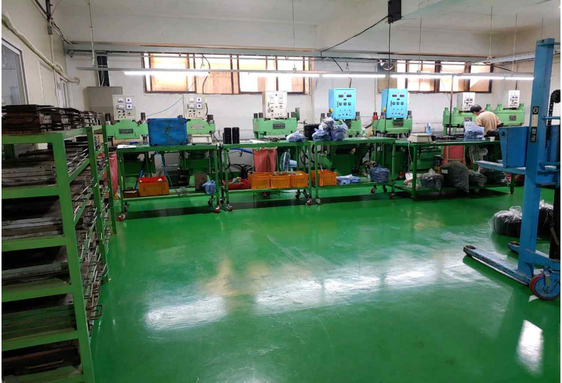
미신고 대기배출시설(성형시설) 운영 사진