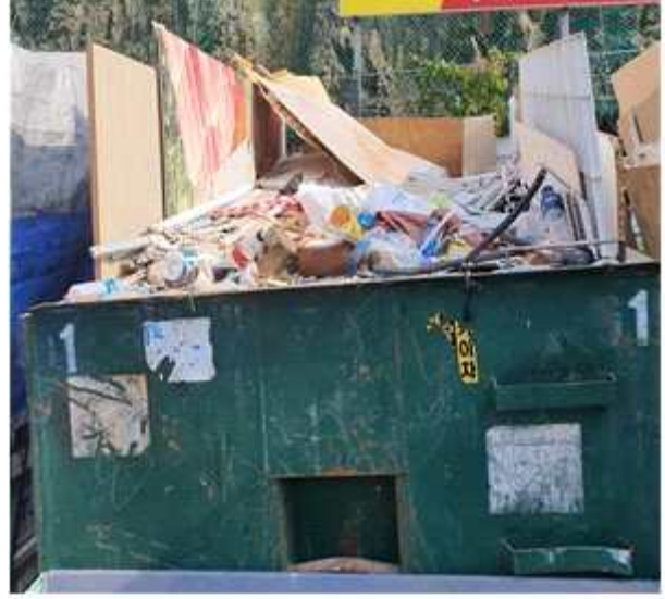
무허가 건설폐기물 처리업 사진