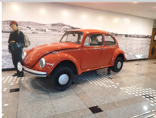
새 단장한 우정 2호